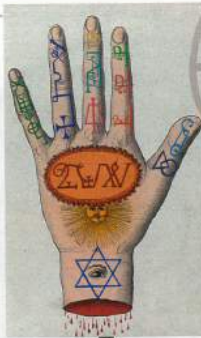
UN'ALTRA ILLUSTRAZIONE CON SIMBOLI E SEGNI CABALISTICI, RIBALENTE AL DICIOTTESIMO SECOLO.

Questo nome impronunciabile (anche perché formato da quattro consonanti, Yhwh, che la tradizione cristiana legge Jahvè) è posto al vertice di una serie di epiteti divini: sono sette, sono dieci, sono settanta. Sono i nomi di Dio. Attorno al loro significato segreto nasce una delle correnti cabalistiche più note: la cosiddetta "cabala pratica", cioè la magia. Il suo influsso sulla tradizione esoterica cristiana - quella colta, ma anche quella popolare - sarà enorme: basti pensare che diversi studiosi vi rintracciano le origini della Smorfia napoletana. Colui che conosce "i nomi" può sfruttarne le capacità